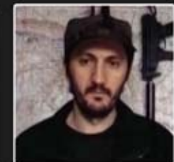
Сейфулла, командир об'єднаного фронту Кабарди, Балкарії та Карачая