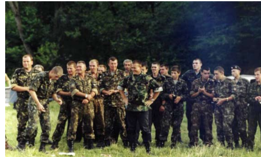
Бійці Тризубу на вишколі

Якщо будемо і надалі притримуватися такої лінії, тоді маємо всі шанси на зміцнення спільного для християн і мусульман антиімперського руху і, врешті-решт, на перемогу Добра над злом. Це наша позиція.