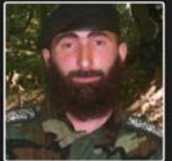
амір Магас, військовий амір