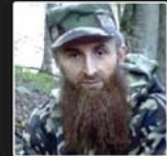
Суп'ян, набіб аміра ІК