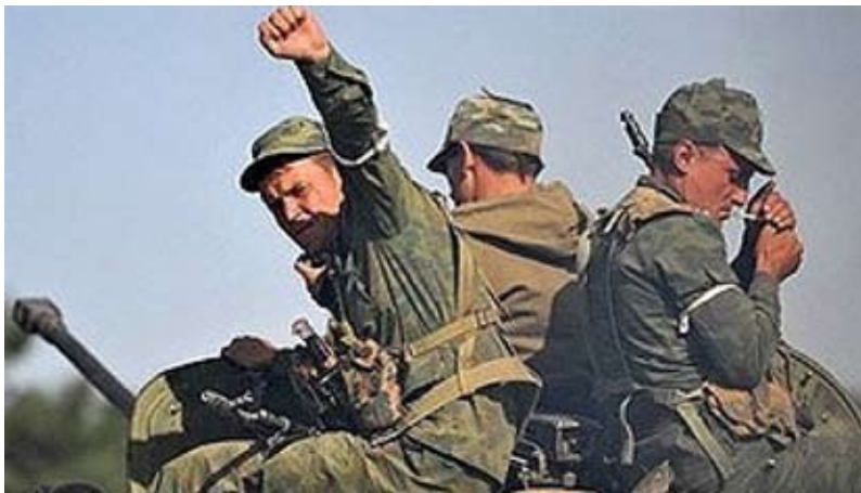
Російські окупанти в Грузії

Якийсь час була надія на те, що у влади Російської Федерації вистачить, як мінімум, здорового глузду не підставляти свою країну. На жаль, цим надіям не судилося збутися. Росія не просто почала війну з Грузією, але й зробила спробу повністю окупувати її, змінивши законно обрану владу країни на свій маріонетковий режим.