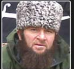
Докка Умаров, амір Імарату Кавказ