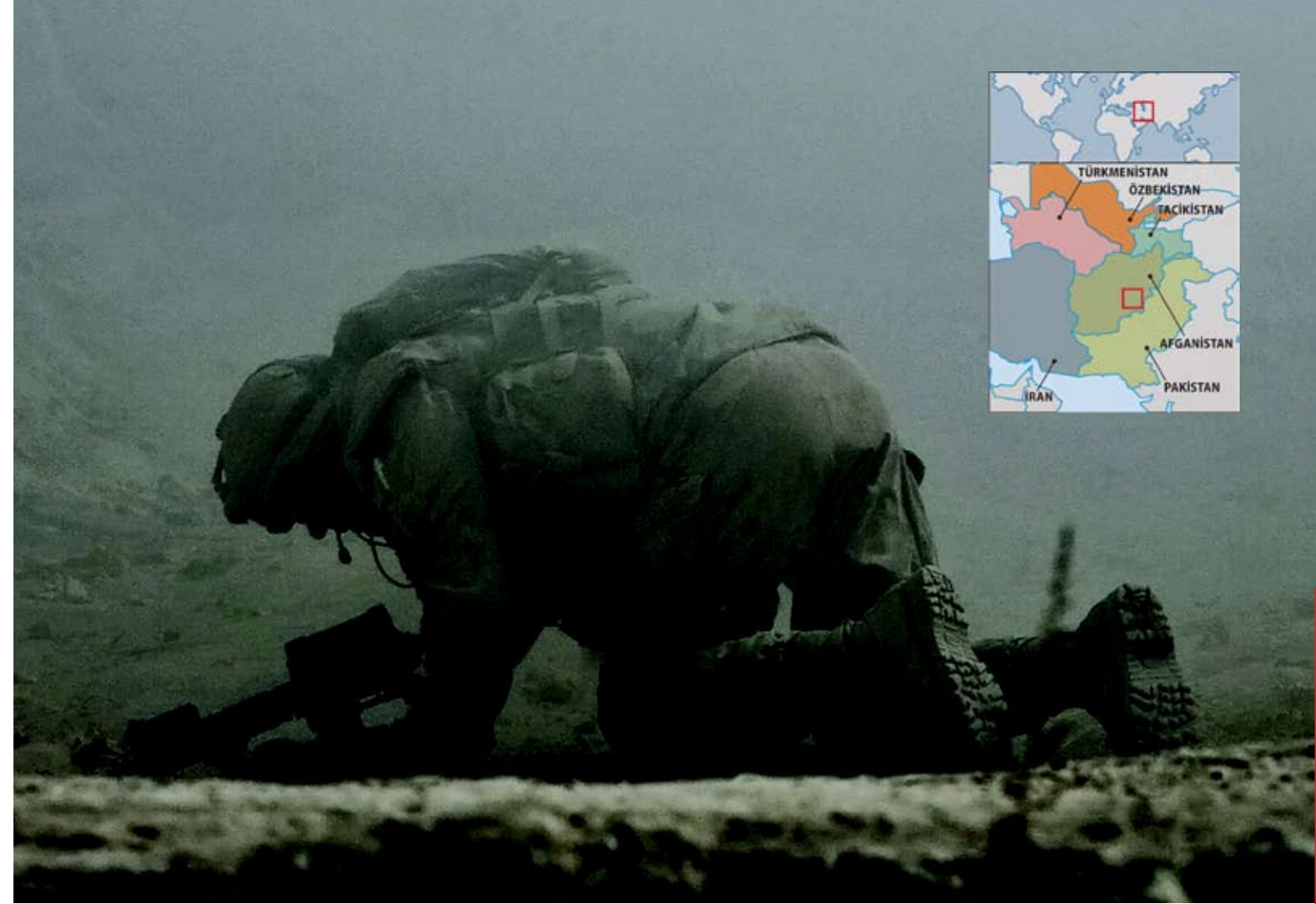
Хто і чому чинить опір в ісламському світі?