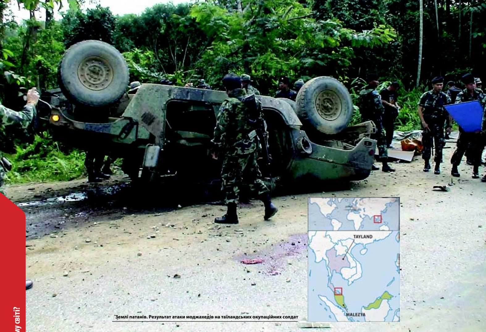
Землі патанів. Результат атаки моджахедів на тайландських окупаційних солдат